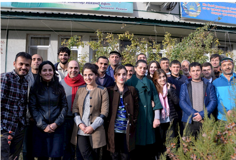
Intercultural Tour Guide Qualification „Basic“ für englischsprachige ReiseleiterInnen von PECTA (Pamir Eco-Cultural Tourism Association), Khorog, Tadschikistan, November 2017

Die Ergebnisse weiterer Forschungsdaten zum Thema „Erwartungen an die Reiseleitung in Entwicklungs- und Schwellenländern“ werden in einer Neuauflage der Studie „Tourismus in Entwicklungs- und Schwellenländer“ im