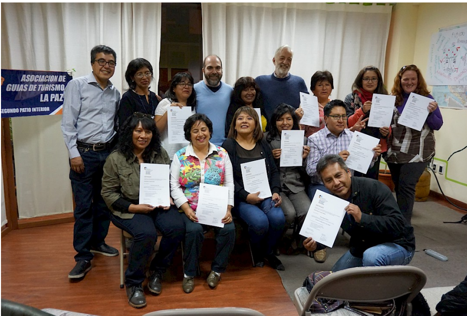
Intercultural Tour Guide Qualification „Sustainability“ für ReiseleiterInnen der bolivianischen Reiseleitervereinigung, La Paz, Bolivien, März 2019